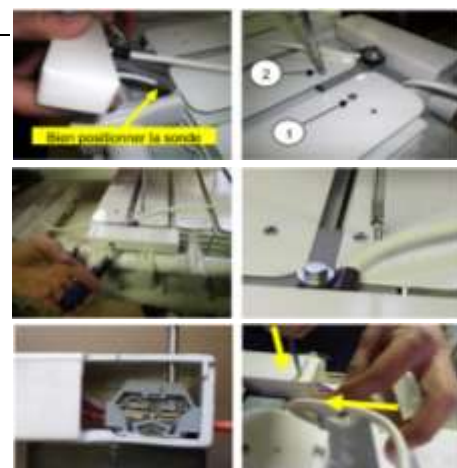
principe du bornier

Etape n°5 : Remettre en place la sonde d'ambiance.