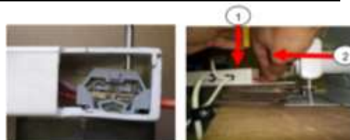
principe du bornier

Etape n°1: Remettez les 6 fils. Il faut appuyer sur le bornier, puis, en maintenant cette pression, introduire le fil. Une fois que le fil est bien placé, relâchez la pression sur le tournevis et vérifiez que le fil est correctement introduit dans le bornier en le tirant légèrement. Puis remettez les obturateurs. Respecter l'ordre de montage des 6 fils selon votre schéma de l'étape 4